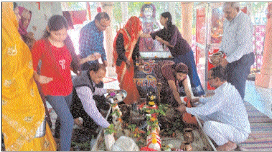
भक्तों ने रामायण पाठ के साथ विशेष धार्मिक आयोजन भी

बयाना ( हुक्मनामा समाचार )। बयाना कस्बा सहित पूरे उपखंड क्षेत्र में रविवार को भगवान भोलेनाथ की भक्ति का त्यौहार महाशिवरात्रि पर्व धार्मिक श्रद्धा और उल्लास के साथ मनाया गया। इस दिन शिव मंदिरों में खास रौनक देखने को मिली। जगह जगह शिव मंदिरों में आस्था का सैलाब उमड़ता दिखाई दिया। मंदिरों में सुबह से ही बम-बम भोलो, हर-हर महादेव के जयकारे गुंजते रहे। भगवान शिव का जलाभिषेक करने के लिए भक्तों में होड़ मची रही। बयाना के ऐतिहासिक किले पर स्थित प्राचीन पहाड़ेश्वर शिव मंदिर में